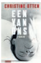
FICTIE CHRISTINE OTTEN EEN VAN ONS De Geus, €20 238 blz.

"Waarom ik dit ben gaan doen? Ik vind lesgeven leuk. Heb het gedaan op de Rietveld Academie, en ik heb tien jaar lang schrijfgroepen gedaan met dak- en thuislozen. En ook aan een groep gedetineerden die op weg waren naar hun